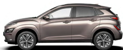
Silky Bronze Metallic Kontrastdach verfügbar