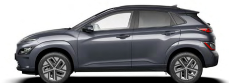
Dark Knight Gray Pearl Kontrastdach verfügbar