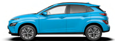
Dive Blue Kontrastdach verfügbar