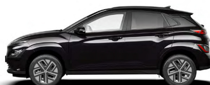
Phantom Black Pearl