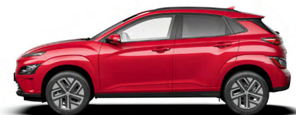
Sunset Red Pearl Kontrastdach verfügbar