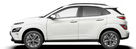
Serenity White Pearl Kontrastdach verfügbar