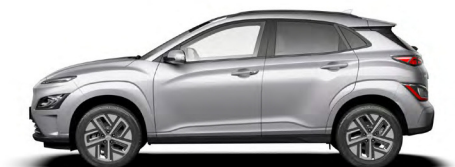
Shimmering Silver Metallic Kontrastdach verfügbar