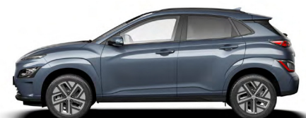
Dark Teal Metallic Kontrastdach verfügbar