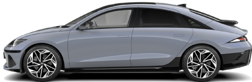
Transmission Blue Pearl