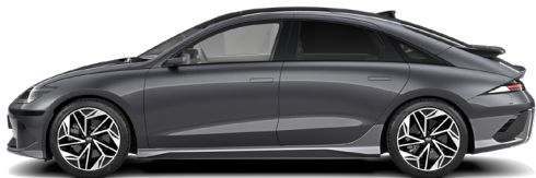
Nocturne Gray Metallic