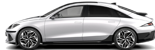
Curated Silver Metallic