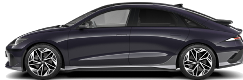
Biophilic Blue Pearl