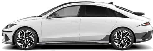
Serenity White Pearl