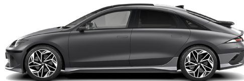
Nocturne Gray Matte