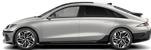
Gravity Gold Matte