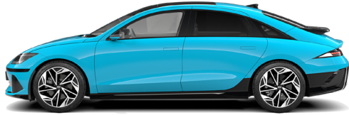
Byte Blue Pearl