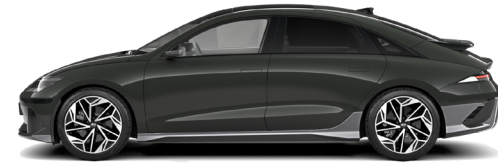
Digital Green Pearl