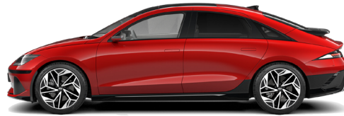
Ultimate Red Metallic